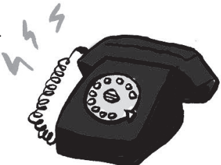
Som de um telefone de disco tocando.